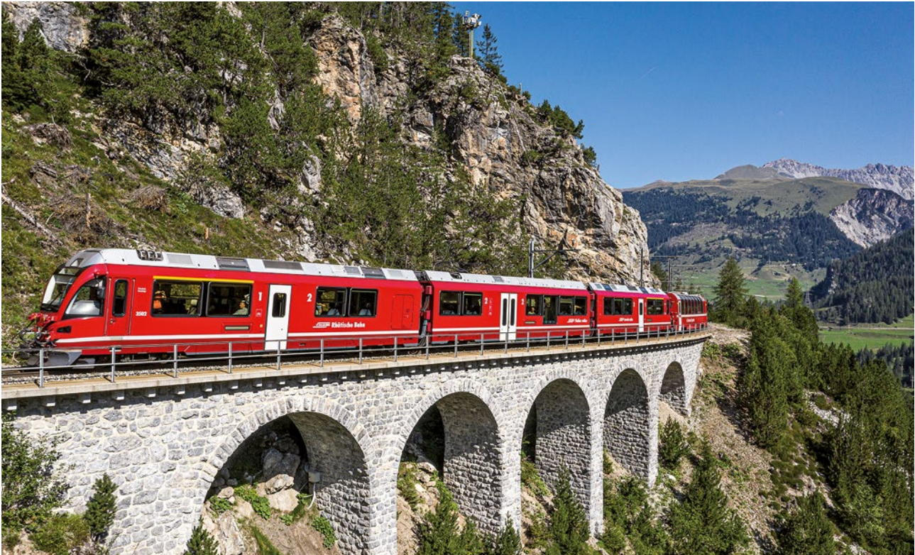
Train régional sur le viaduc de Lehnen.