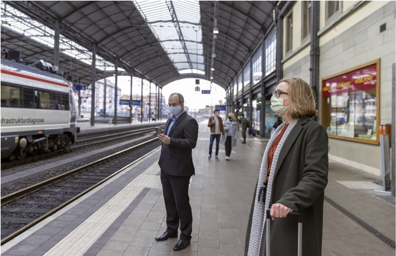
Port obligatoire de masques dans les transports publics en raison du Covid-19. Gare d'Olten